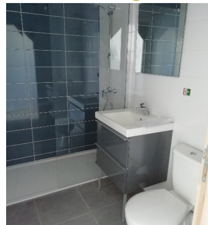
Salle de bain - La maison ●