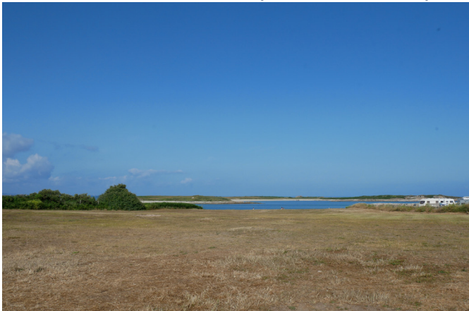
Terrain en face du centre