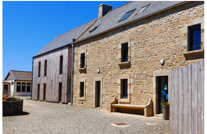
Extérieur du centre