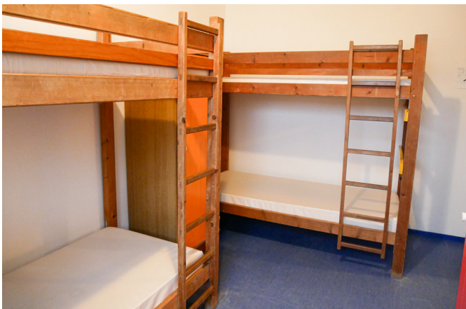
Chambre dortoir - Triagoz ou 7 îles ●

● Formule privatisation partielle 69 personnes