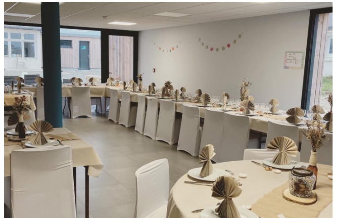
Salle Molène - 60 personnes