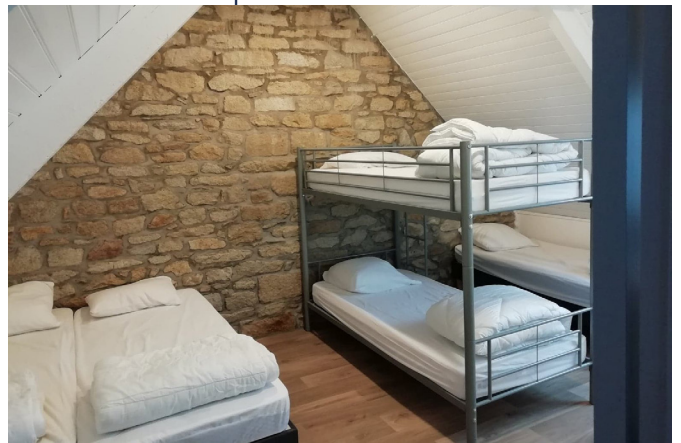
Chambre dortoir - La maison ●