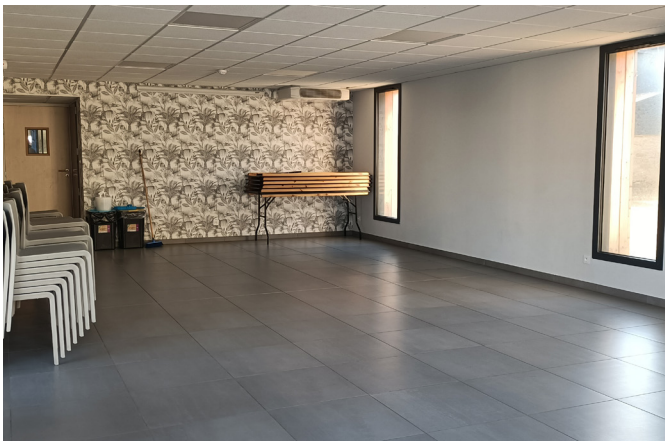
Salle Miliou - 60 personnes