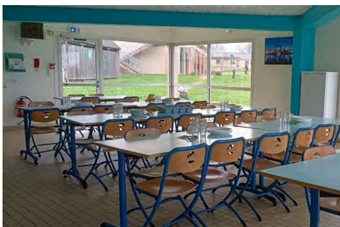
Salle de restauration