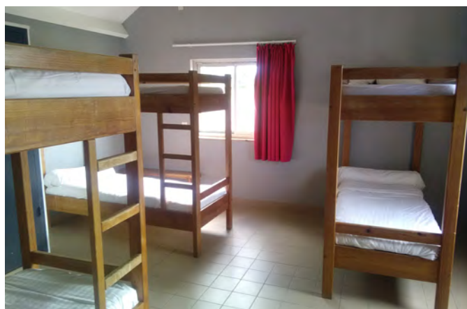
Chambre bâtiment 3