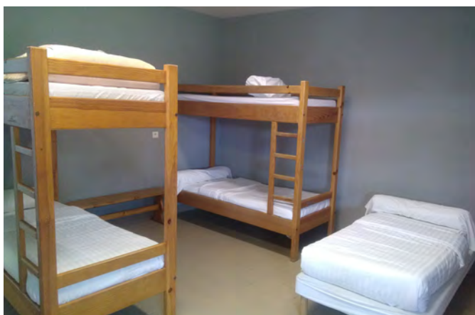
Chambre bâtiment 3