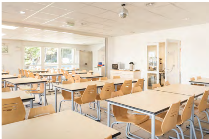
Salle de restauration ● ●