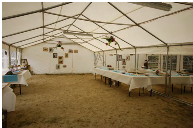
Chapiteau - 120m2 ● ●